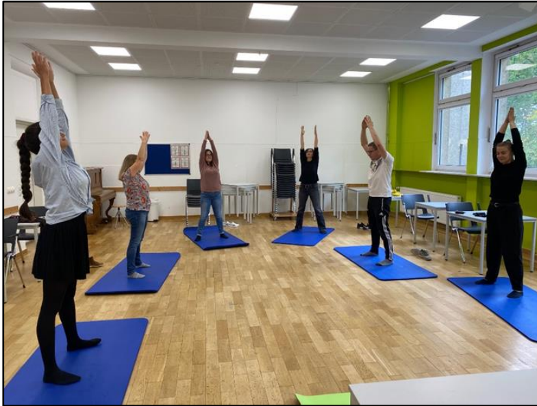
Bewegte Mittagspause im Raum „Botanik“

Einmal in der Woche – immer mittwochs – gestalten die Mitarbeiter*innen der vhs Gießen unsere Mittagspause sportlich aktiv.