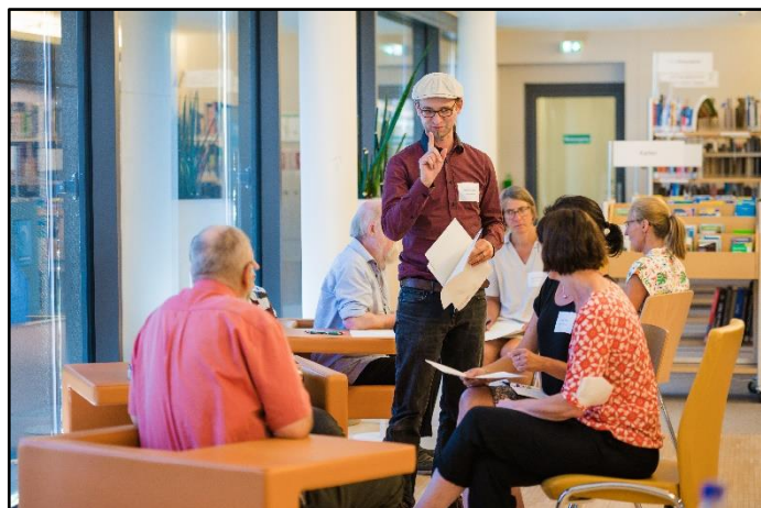
Momentaufnahme aus den Workshops

Organisiert wurde die Tagung vom Hessischen Museumsverband, dem Deutschen Bibliotheksverband, der Landesvereinigung Kulturelle Bildung/LandKulturPerlen, dem Oberhessischen Museum in Gießen, dem Hessischen Volkshochschulverband und der Volkshochschule Gießen.