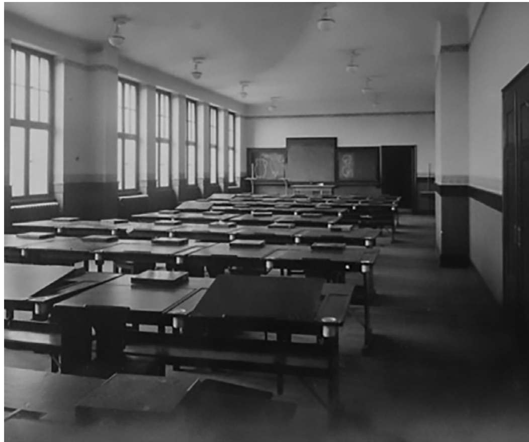
Abb. 3: Zeichensaal der Oberrealschule Gießen