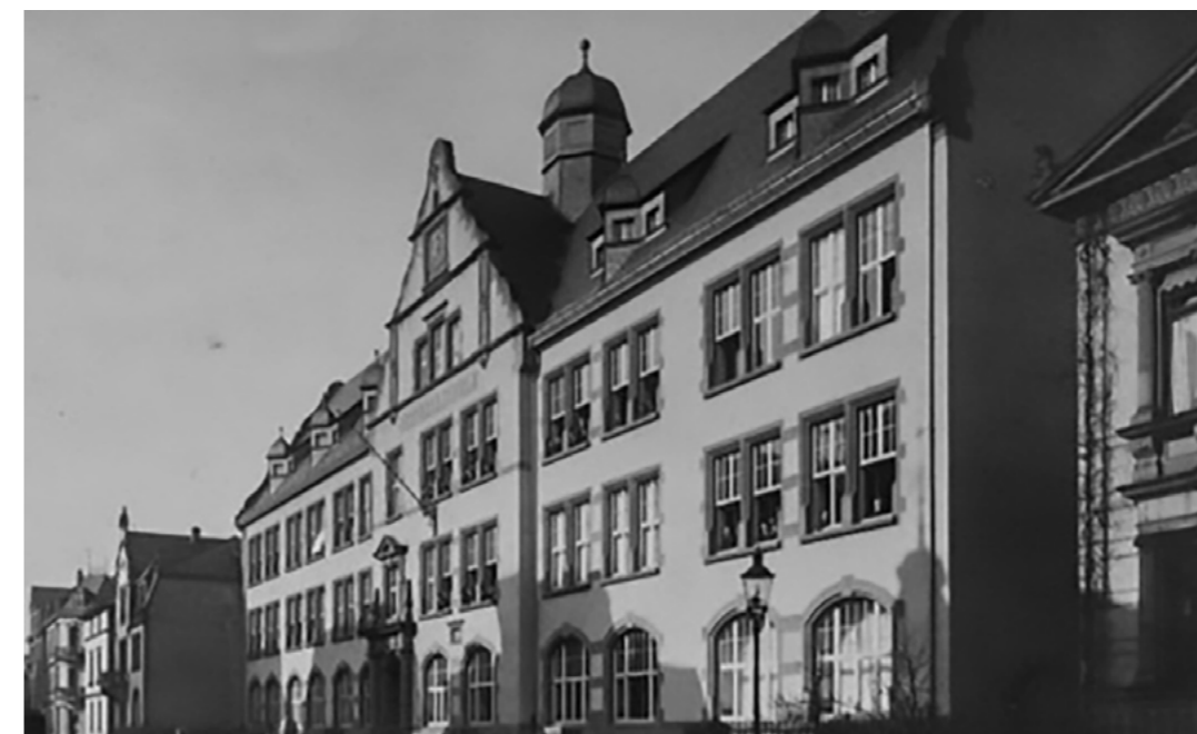
Abb. 2: Die Oberrealschule Gießen 1914, vom der Stephanstraße aus gesehen (heutige Liebigschule).

Dennoch blieb es in der gesamten Zeit der Weimarer Republik schwierig, die finanziellen Mittel für den Unterrichtsbetrieb aufzubringen. Die Kursgebühren konnten nur einen kleinen Teil des Etats decken. So war die VHS immer auf eine Unterstützung durch die Stadt und das Land angewiesen. Die Mitglieder des Gießener Trägervereins mussten einen Großteil ihrer Arbeit für die Finanzierung aufwenden; die Inflation und später die Weltwirtschaftskrise brachten die Volkshochschule in besondere finanzielle Schwierigkeiten. Deshalb konnte die Volkshochschule keine dauerhafte Stelle für die Leitung einrichten und die Geschäftsstelle befand sich lange in der Privatwohnung eines Leitungsmitglieds.